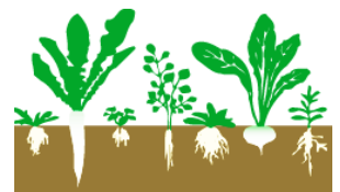
ナズナ スズシロ ハコベラ セリ ホトケノザ スズナ ゴギョウ

「おみなえし・おばな(ススキ)・ききょう なでしこ・ふじばかま・くず・はぎ」と、 どれも観て楽しむ植物。春の七草が すべて食用なのに比べると面白いです。